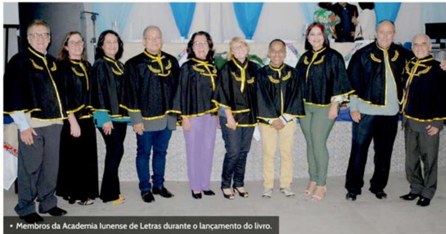
• Membros da Academia Iunense de Letras durante o lançamento do livro.

Academia de Letras lança livro de biografias de patronos e membros