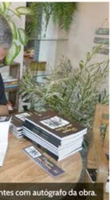
• Livros com autógrafa da obra.