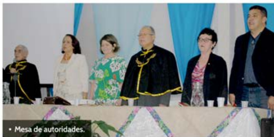
• Mesa de autoridades.

Este livro será a quinta publicação da arcádia, sendo que os anteriores tiveram como finalidade divulgar trabalhos produzidos por acadêmicos e alunos das escolas do município.