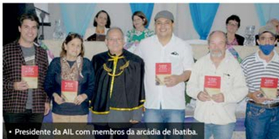
• Presidente da AILA com membros da arcádia de Ibatiba.