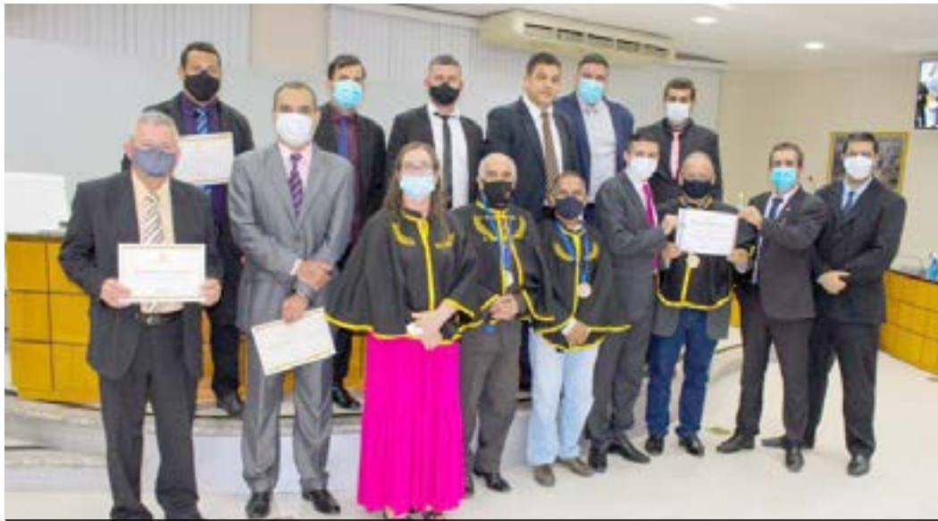
▪ Integrantes da Academia Iunense de Letras fizeram entrega de certificados aos vereadores.

Data escolhida foi 29 de setembro, dia do nascimento do poeta Michel Antônio